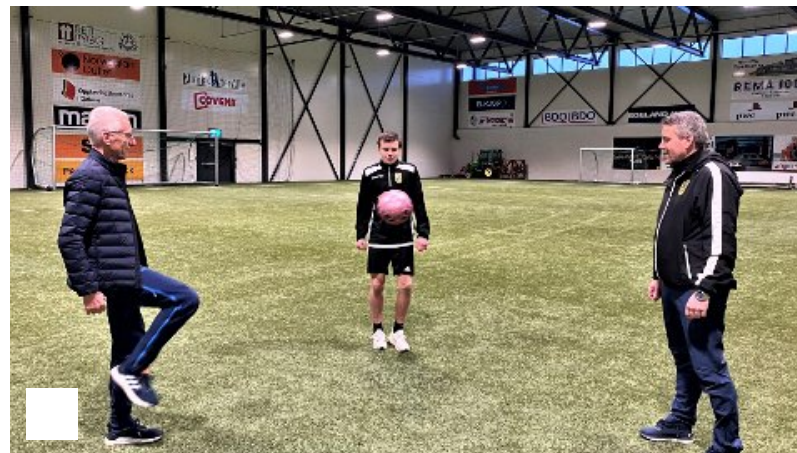
Farfar (71) ser at det er mykje fotball i Sondre (18), men det er ennå ein god del i han sjølv òg