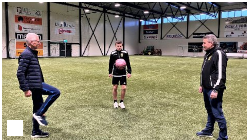
Farfar (71) ser at det er mykje fotball i Sondre (18), men det er ennå ein god del i han sjølv òg