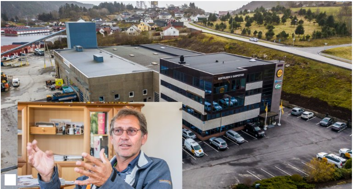
- Plutseleg blei det høgaktuelt å flytta rubbel og bit av B&G