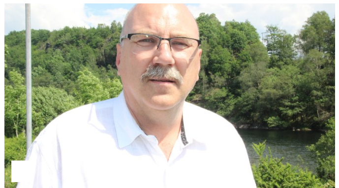
Har arbeid i fem år for R1, torsdag kom slaget